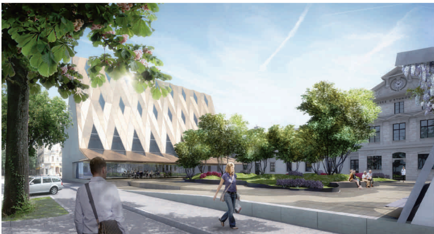
L'extension du MEG : vitale à l'élan de Genève

La FMB soutient évidemment ce projet et appelle à voter OUI à un MEG moderne, durable, attrayant dans un cadre verdoyant.